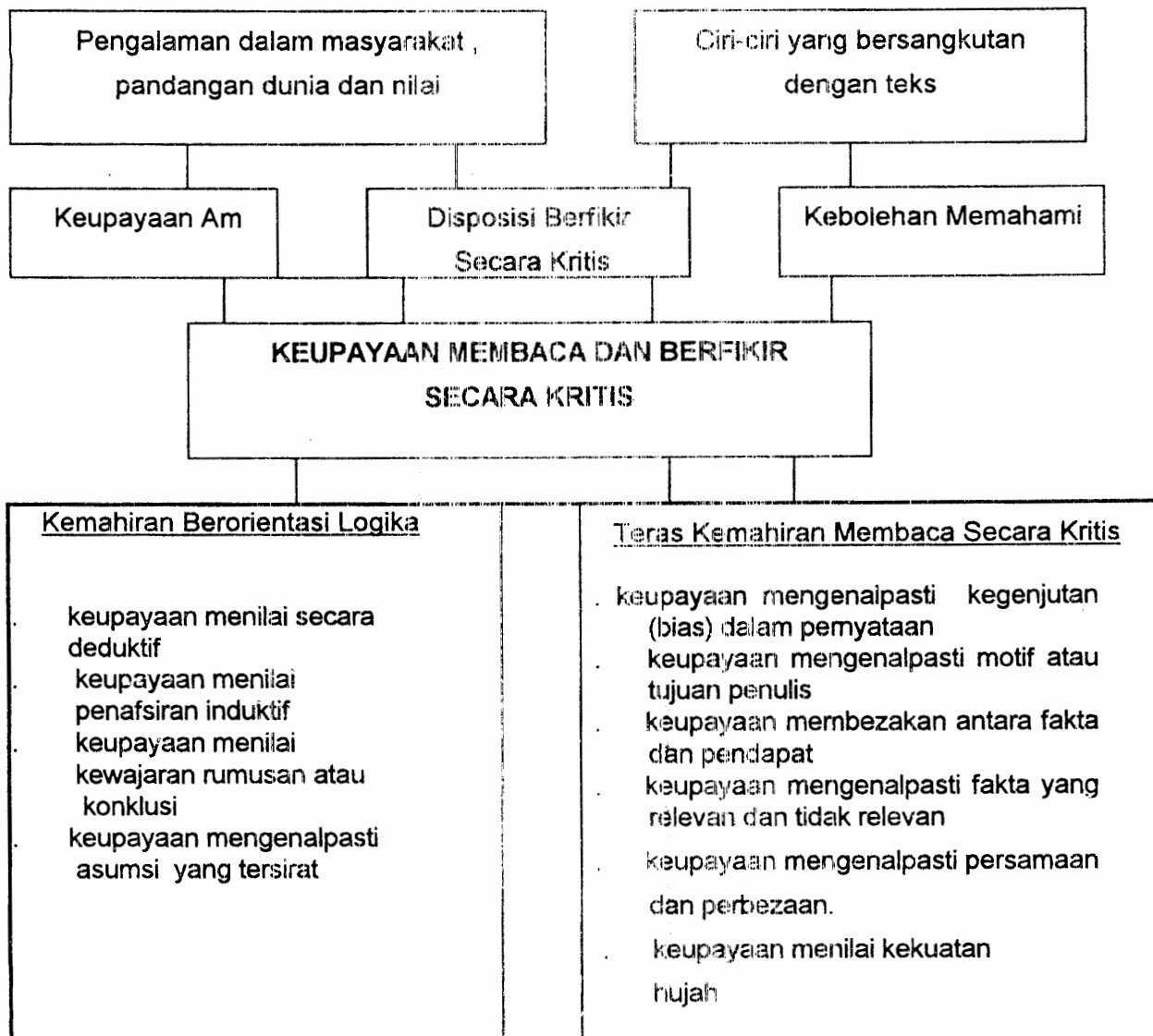
Gambarajah 1 MODEL KONSTRUK AWAL MEMBACA DAN BERFIKIR SECARA KRITIS