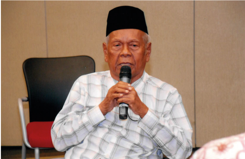
Dr Muhammad Ariff Ahmad sentiasa memberi pandangan beliau yang bernas tentang perkembangan bahasa dan persuratan Melayu.