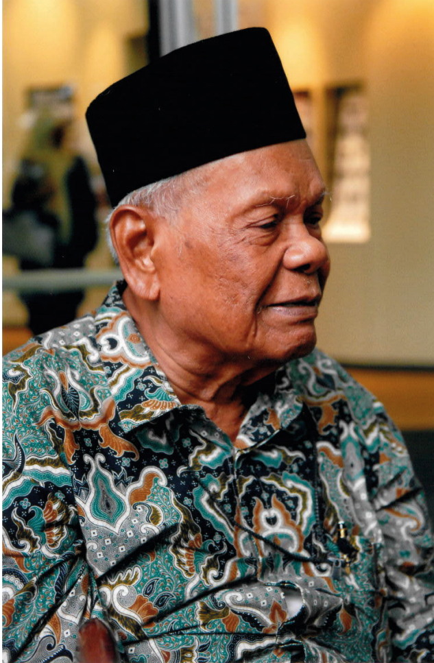
Pendeta Dr Muhammad Ariff Ahmad (1924-2016)